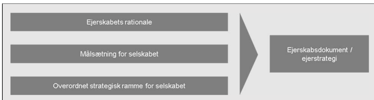
Figur 1: Styringshierarki for ejerskabsudøvelse

I det følgende behandles de enkelte punkter i styringshierarkiet mere detaljeret.