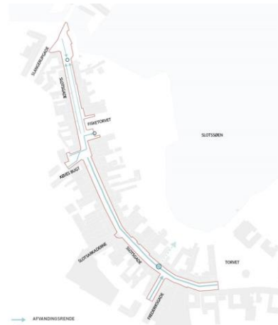
Figur 2 Slotsgade